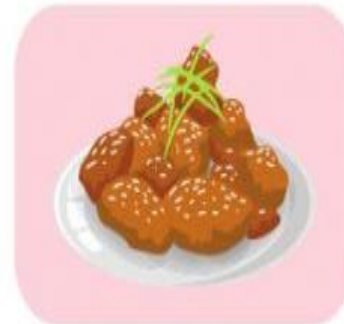
Usaha kuliner rumahan