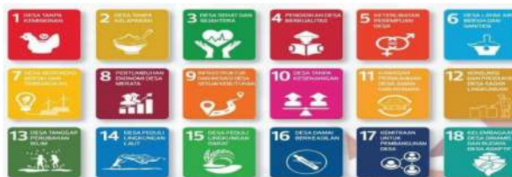
Gambar 1. Tujuan SDG's Desa

Sumber: Pedoman Umum Pembangunan Desa dan Pemberdayaan Masyarakat Desa, 2021.