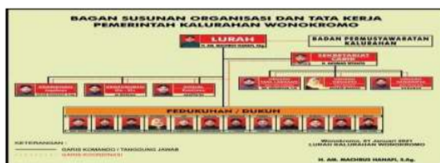
Gambar 2. Struktur Organisasi dan Tata Kerja Pemerintah Kalurahan Wonokromo