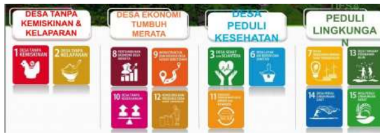
Gambar 2 Delapan Tipe Desa Merujuk paa Sasaran SDGs Desa