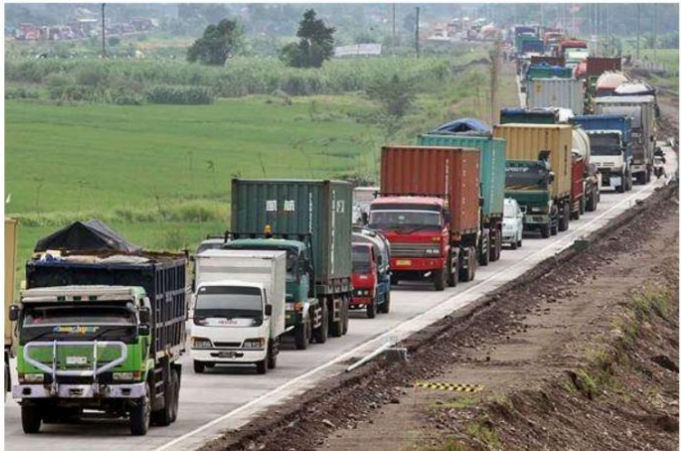
Antrean panjang kendaraan terjebak kemacetan.